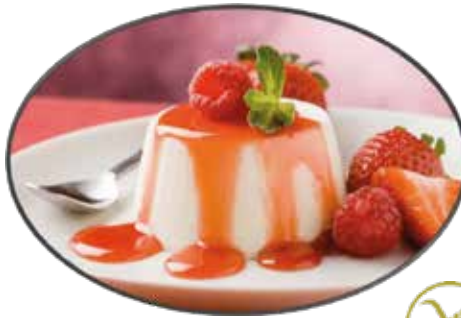
2. Pannacotta alla fragola 5.75