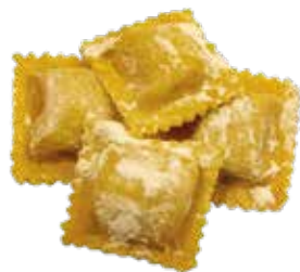
Ravioloni de Carne XL (+2.95€)