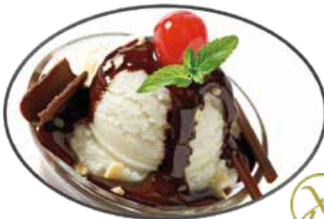
10. Vanilleeis mit Schokolade 6.95