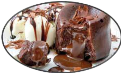
4. Coulant 7.95