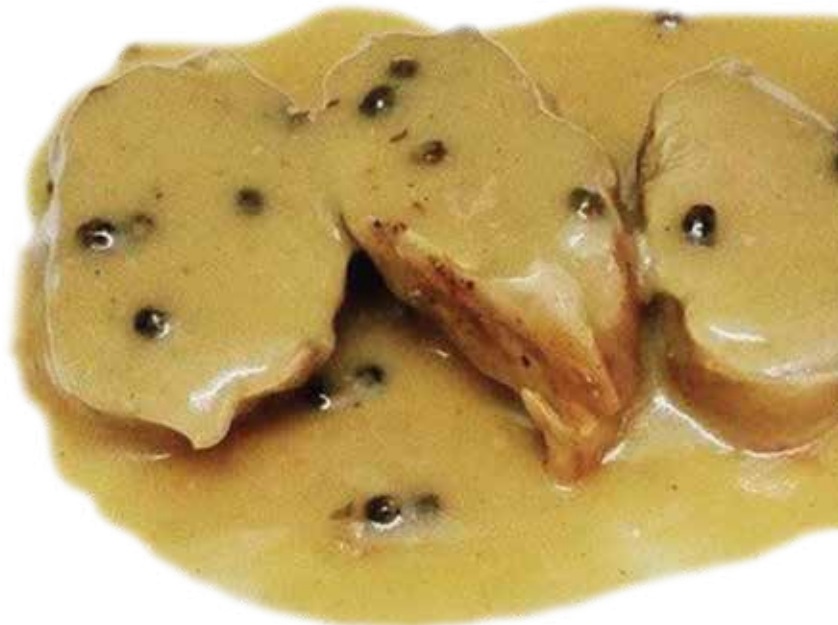
Scaloppine au poivre noire