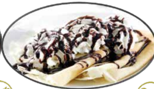
8. Crêpe au chocolat et à la crème 6.75