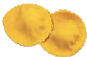
Pansotti Funghie Tartufo XL (+2.95€)