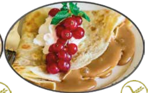
9. Crêpe sucrée au caramel au lait 6.75