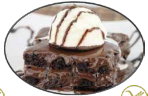
3. Brownie et glace à la vanille 7.35