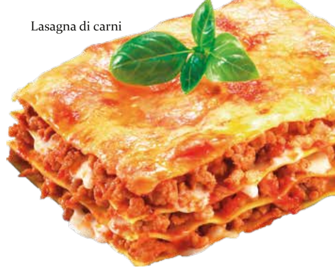
Lasagna di carni