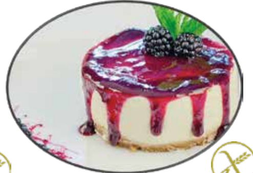
6. Cheesecake 6.95