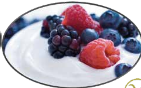
5. Crème de yaourt aux fruits rouges 4.95