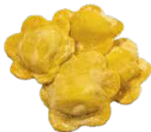
Girasoli Gorgonzola y Pera XL (+2.95€)