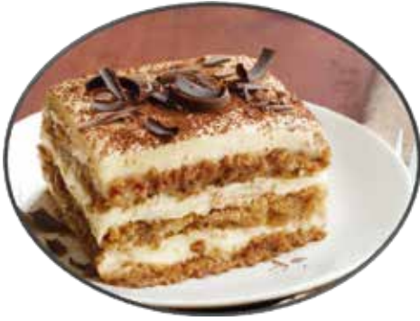
1. Tiramisu 7.35