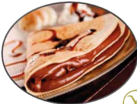
7. Crêpe de Nutella et glace à la vanille 6.95